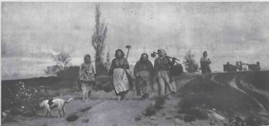
KOZAKIEWICZ. Powrót z kopania ziemniaków. Olej