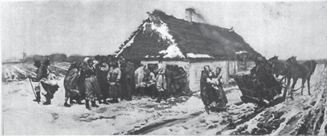
JÓZEF CHEŁMOŃSKI. Przed karczmą, 1875. Olej

Te niezwykle ważne wskazania Stalina są dla nas ni- cią przewodnią do rozstrzygnięcia zagadnienia narodo- wej formy sztuki o socjalistycznej treści.