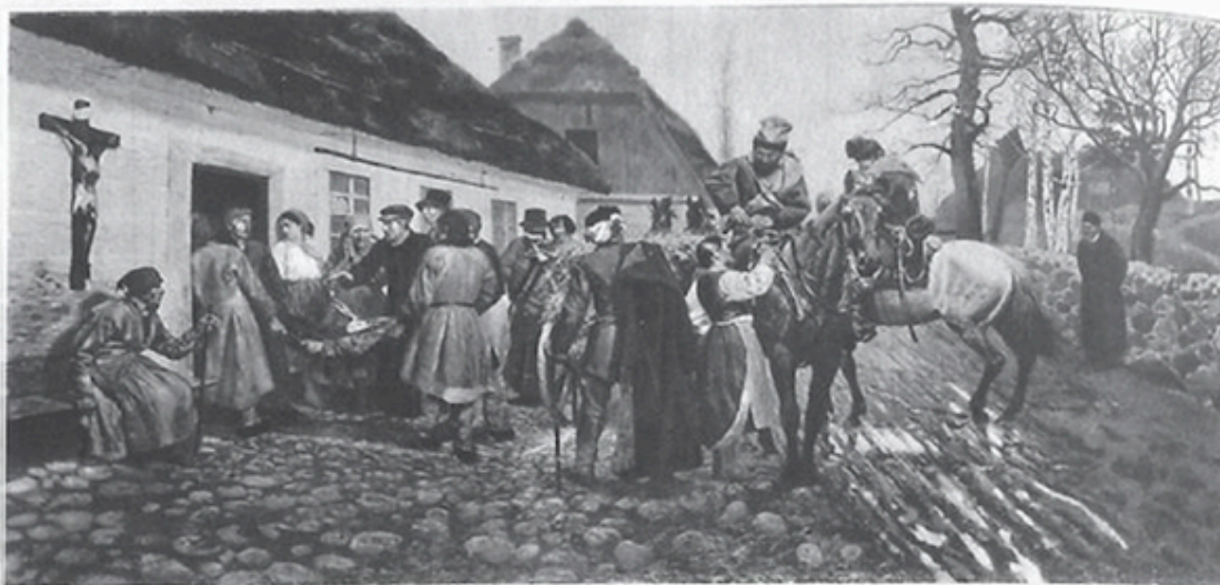
STANISŁAW WITKIEWICZ. Ranny powstaniec. Olej

one niezrównanie bardziej ogólnoludowe, niż jakikolwiek naród burżuazyjny 10)