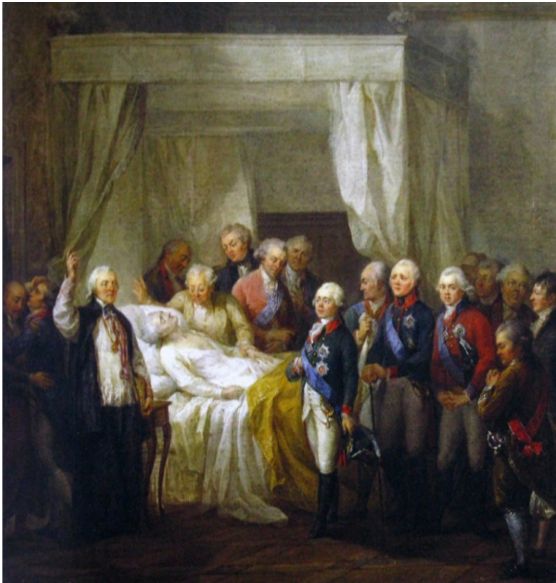
Marcello Bacciarelli, Śmierć Stanisława Augusta , po 1798, płótno, olej, kolekcja prywatna

Zmarłego pożegnano z nadzwyczajnymi honorami, ciało ubrane mundur udekorowane wstęgą orderu Orła Białego. 22 lutego „odbyła się niezwykła ceremonia, w której uczestniczył cesarz, księżę Conde