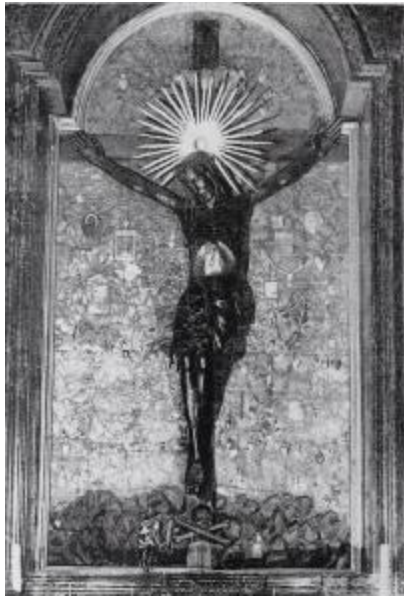
3. Krucyfiks zwany królowej Jadwigi , 4. ćw. w. XIV. Katedra na Wawelu