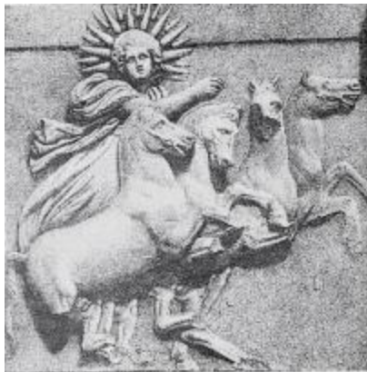
4. Helios na rydwaniu słonecznym (wg W.H. Roscher, Ausführliches Lexikon der griechischen und römischen Mythologie , Leipzig 1886—1890, s. 2003) (repr. J. Sito).