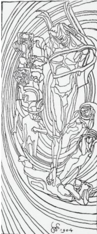
1. Stanisław Wyspiański, Apollo – System Kopernika , litografia 1904. Kraków, Muzeum Wyspiańskiego