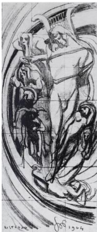
2. Stanisław Wyspiański, Szkic do witrażu, Apollo – System Kopernika , rys. 1904. Kraków, Muzeum Wyspiańskiego