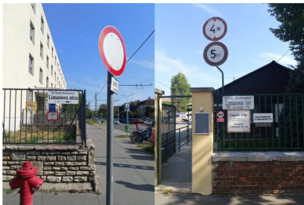
Fot. Paweł Chojnacki, Budapeszt 2024

[6] Bitwa o dobrze ufortyfikowane wzgórze Jabłonec miała miejsce 11 grudnia 1914 roku i stanowiła epizod operacji limanowsko-łapanowskiej (7–12 grudnia). Zakończyła się sukcesem wojsk austro-węgierskich i powstrzymaniem rosyjskiej ofensywy w kierunku Krakowa oraz Śląska. W bitwie uczestniczyli – głównie walcząc wręcz – spieszni węgierscy huzarzy. Miejsce zmagania nazywane czasem „węgierskim Monte Cassino” do dziś jest obecne w narodowej pamięci Madziarów. Jeden ze skwerów w Budapeszcie otrzymał nazwę „Limanowa” (choć trzeba przyznać, że na obrzeżach rozbudowującej się do końca współ-stolicy imperium), a bohaterski oficer (od cesarza Franciszka Józefa) pośmiertnie tytuł „von Limanowa”. Oberst Ottmár Muhr spoczywa wraz ze swymi żołnierzami na Cmentarzu nr 368 na Jabłońcu – Limanowej.