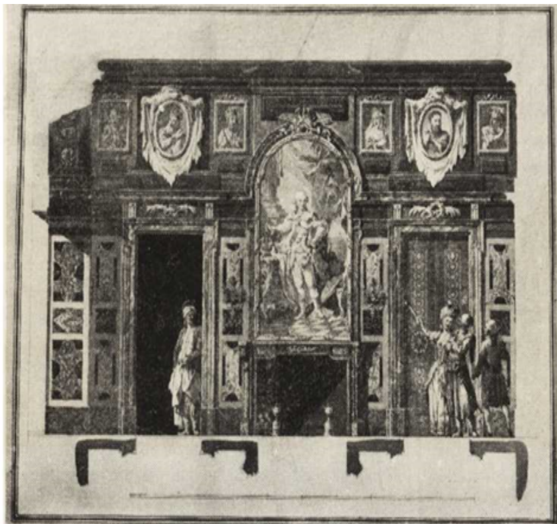
Ryc. 241. Zamek Warszawski. Sala Marmurowa, ściana z kominkiem (XVIII w.) Gabinet Rycin U.W.

W studiach i projektach dla Zamku Warszawskiego, opracowywanych od kilku lat w Urzędzie Konserwatorskim na m. st. Warszawę, wyjaśnione zostały te podstawowe elementy, które muszą stać się punktem wyjścia przy realizacji wielkiej koncepcji odbudowy Zamku.