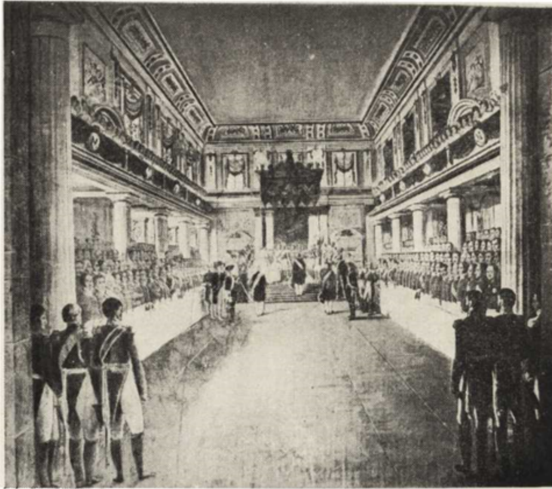
Ryc. 246. Zamek Warszawski. Sala Sejmowa w epoce Królestwa Kongresowego.

Przy rozwiązaniu zagadnienia odbudowy wnętrza Zamku podkreślić należy kilka momentów, które określają dość precyzyjnie kierunek prac i możliwości rozwiązań. Układ i wymiary wnętrza są w znacznym stopniu ograniczone rozstawem ścian, stropów i rozmieszczeniem otworów. Proporcje pomieszczeń i sal są w znacznym stopniu uzależnione od zewnętrznej formy budynku. Będzie więc rzeczą