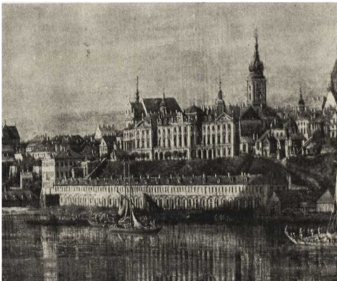
Ryc. 240. Zamek od strony Wisły. Mal. Canaletto (Muzeum Narodowe w Warszawie).

Historyczna decyzja Sejmu Rzeczypospolitej z dnia 2 lipca 1940 rozstrzygnęła pozytywnie zasadniczą sprawę odbudowy Zamku Warszawskiego i w najbliższych latach dostojne oblicze Stolicy Państwa uzyska i ten tak ważny element. Trasa W-Z i konieczna regulacja Placu Zamkowego podniosą jeszcze bardziej jego wartości architektoniczne.