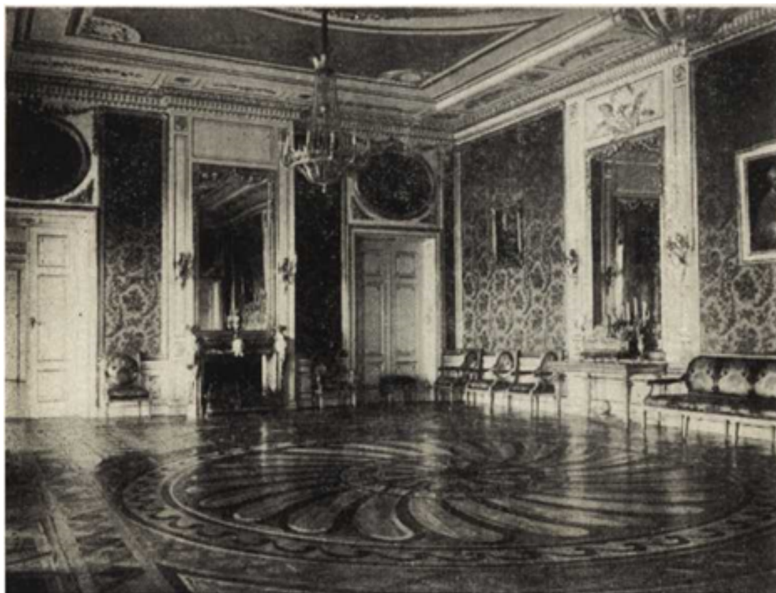
Ryc. 245. Zamek Warszawski. Sala Audiencyjna (dawna).