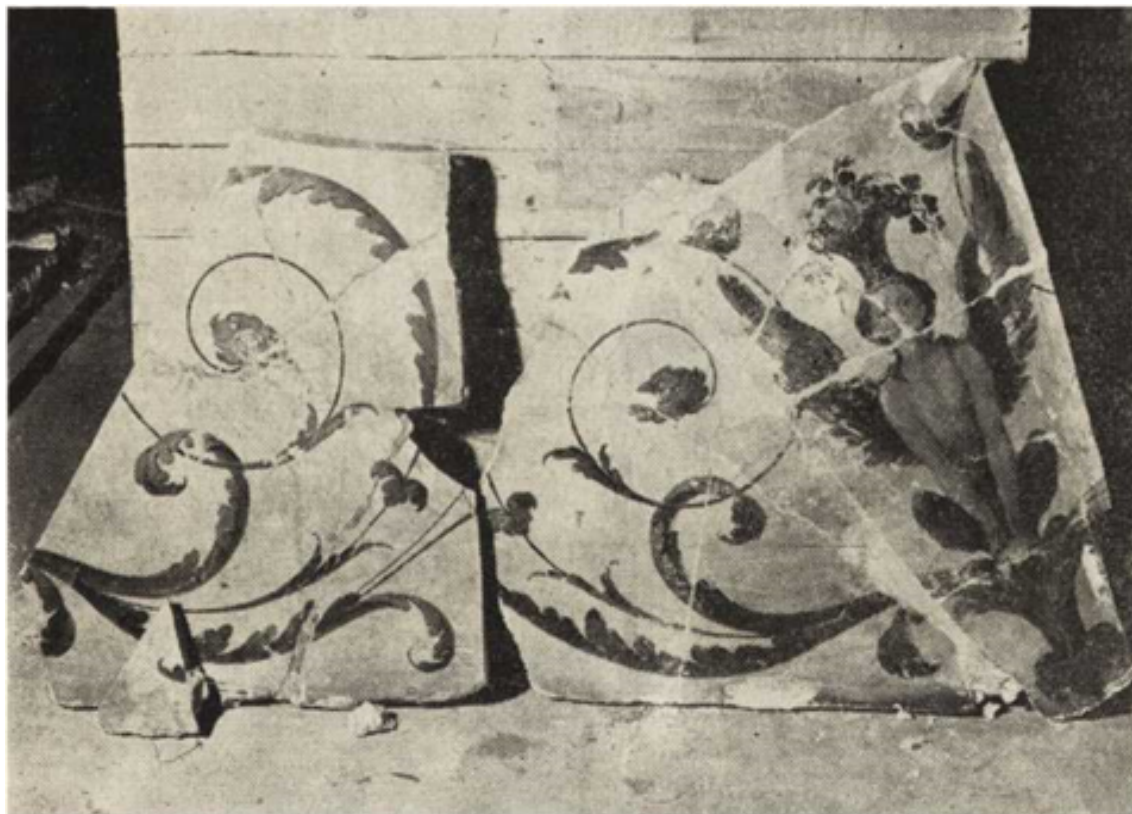
Ryc. 251. Sala Konferencyjna. Autentyczne fragmenty fresków

Realizacja odbudowy Zamku winna być przeprowadzona według najnowszych zasad techniki i organizacji robót budowlanych, które zapewnią urzeczywistnienie uchwały Sejmu w terminie kilkuletnim. Już obecnie można przystąpić do wykonania olbrzymiego zakresu robót przy naprawie i uzupełnieniu zarówno elementów kamieniarskich jak gzymsy, obramienia otworów itp., jak i stolarskich – boazerie, drzwi, okna itp. Praca ta wymaga zatrudnienia licznego zespołu