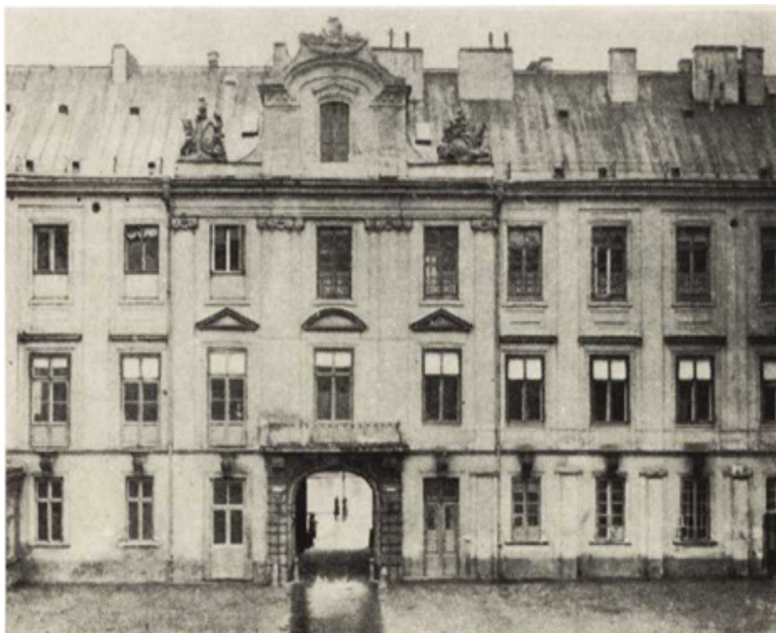
Rvc. 247. Zamek Warszawski. Fasada skrzydła południowego od strony dziedzińca, wykonana wg projektu arch. Merliniego.