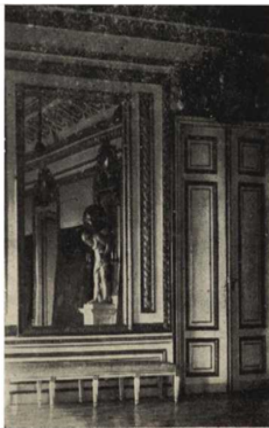
Ryc. 242. Zamek Warszawski. Sala Tronowa.