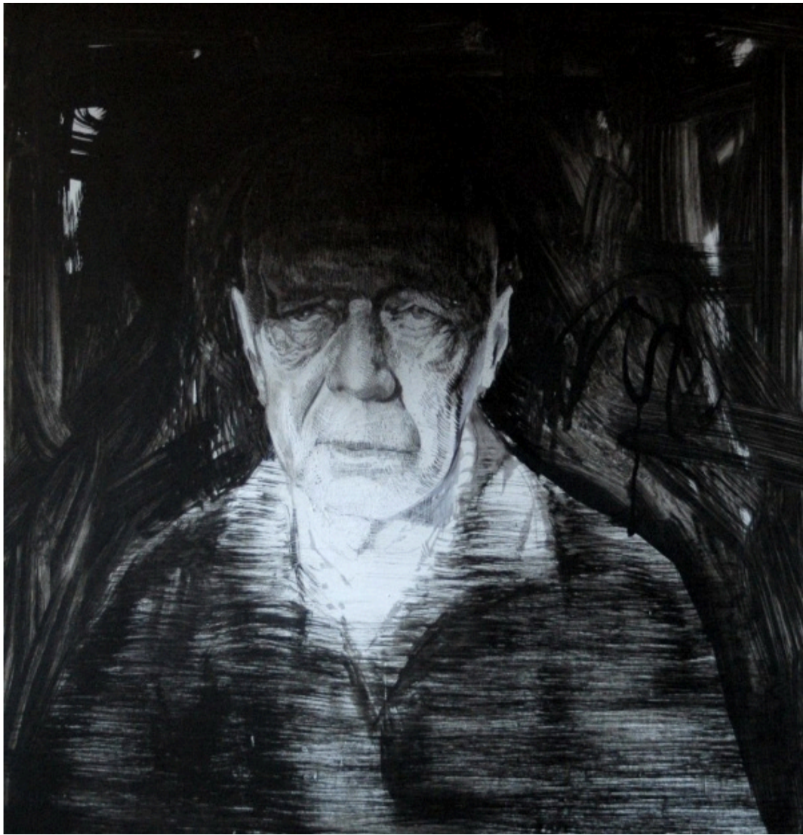
„Homelles Alek” (2014); technique: ink, black marker; size 70x70cm;