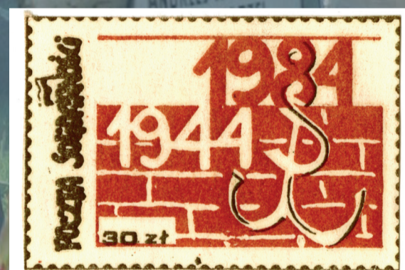
Konspiracyjne znaczki Poczty Solidarności.