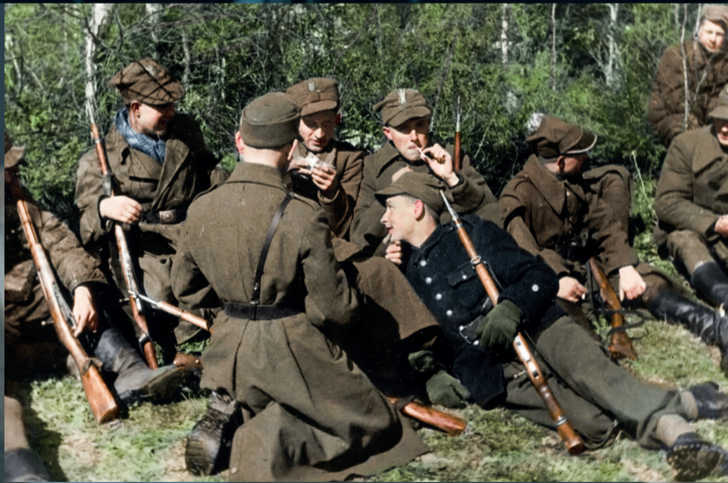
Żołnierze 27 Wołyńskiej Dywizji Piechoty AK.

Wobec przekroczenia w styczniu 1944 r. przedwojennej granicy polsko-sowieckiej przez nacierającą na zachód Armię Czerwoną Armia Krajowa rozpoczęła akcję „Burza”.