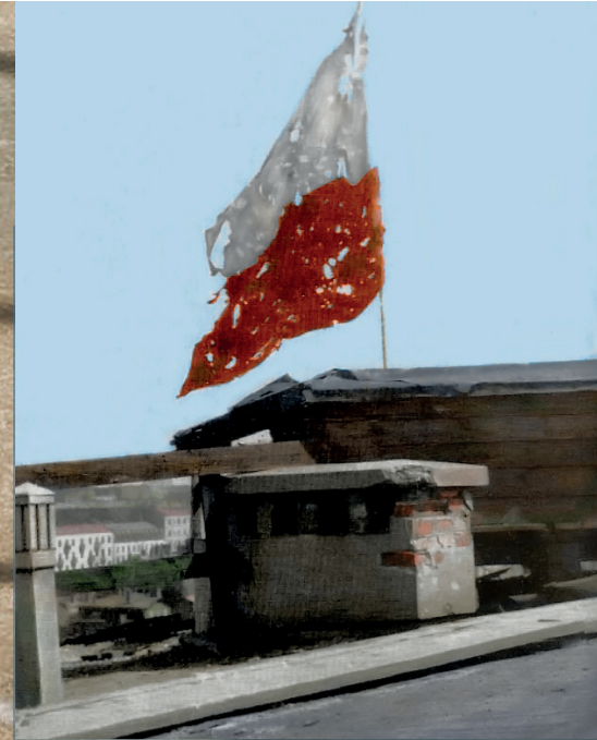
Flaga z przestrzelinami na dachu Domu Turysty przy pl. Starynkiewicza w ostatnich dniach Powstania.

(Andrzej Janicki ps. „Żuliński”, dowódca plutonu w kompanii „Warszawianka” Zgrupowania „Chrobry II” AK)