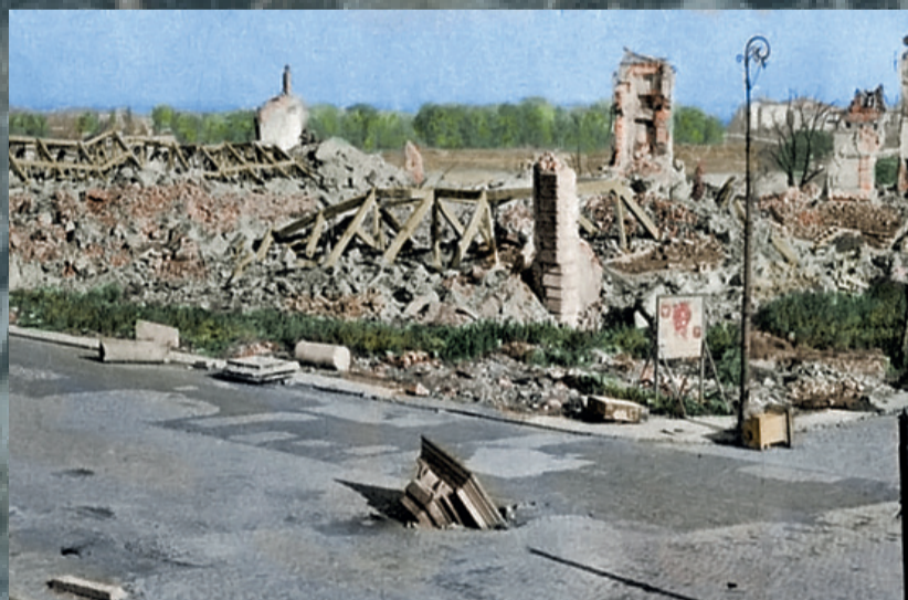
Ruiny Zamku Królewskiego w Warszawie po upadku Powstania warszawskiego w powietrze przez Niemców. Na pierwszym planie fragment kolumny Zygmunta.

Powstanie Warszawskie w 1944 r. jest jednym z najważniejszych wydarzeń w całej naszej historii. Ze względu na straty ludzkie i materialne, jakie ponieśli Polacy, decyzja o jego rozpoczęciu wciąż pozostaje przedmiotem debat i gorących polemik.