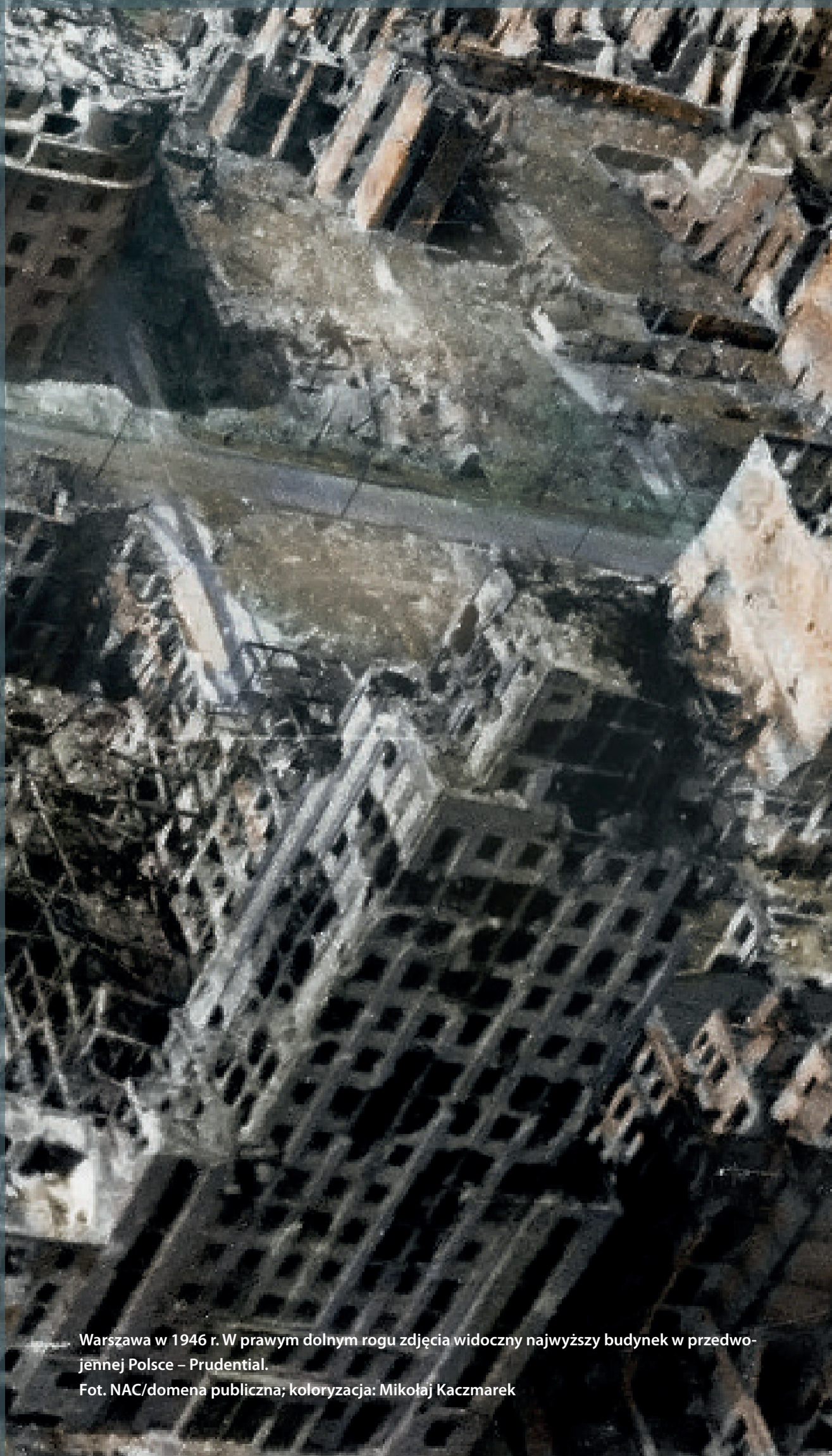
Warszawa w 1946 r. W prawym dolnym rogu zdjęcia widoczny najwyższy budynek w przedwojennej Polsce – Prudential.