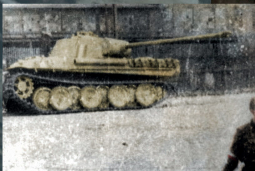
Zdobyczny czołg powstańczy „Magda”, jeden z głównych bohaterów wyzwolenia „Gęsiówki”. Wraz z drugim czołgiem, oznaczonym literami „WP”, był używany przez samodzielny pluton pancerny „Wacek”, wchodzący w skład batalionu „Zośka” AK. Fot. Juliusz B. Deczkowski/domena publiczna; koloryzacja: Mikołaj Kaczmarek