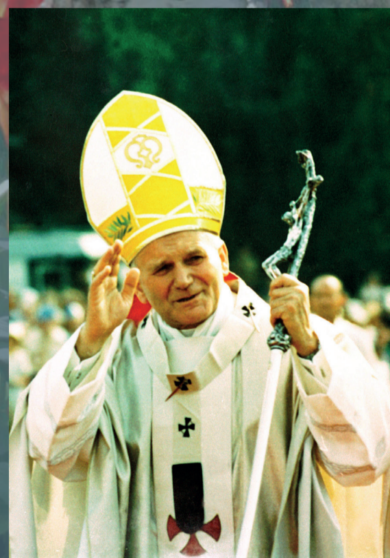
Papież Jan Paweł II na pl. Zwycięstwa w Warszawie 2 czerwca 1979 r.

1 sierpnia 2005 r. na cmentarzu powązkowskim w Warszawie.