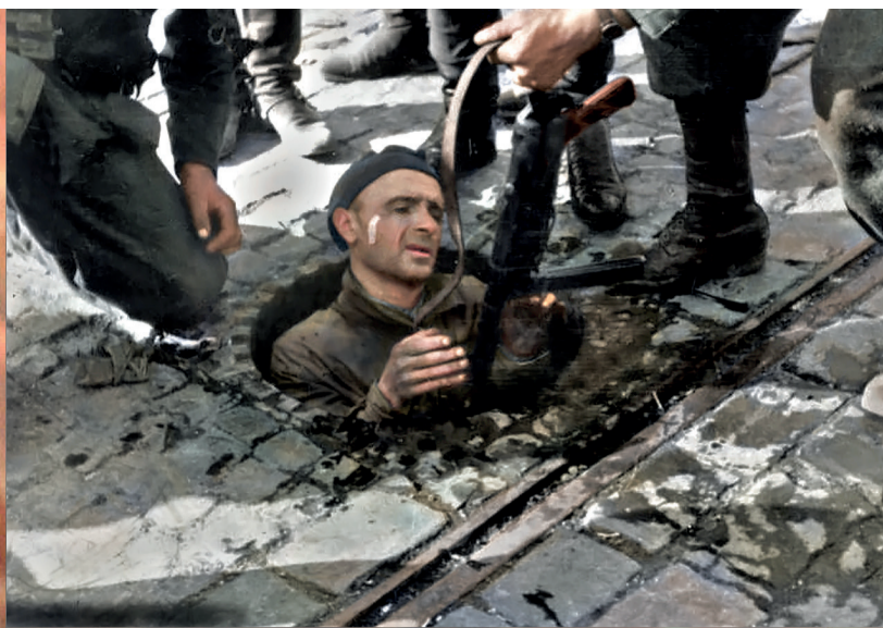
Powstaniec wychodzący 27 września 1944 r. z kanału przy ul. Dworkowej na Mokotowie wprost w ręce Niemców. Tego dnia w dwóch egzekucjach Niemcy zamordowali około 140 wychodzących z kanałów i wziętych do niewoli żołnierzy AK.

Do rangi symbolu Powstania Warszawskiego urosły kanały. Początkowo były wykorzystywane przez Powstańców do utrzymania łączności między rozdzielonymi przez Niemców częściami miasta. W drugiej fazie Powstania stały się jedyną drogą ewakuacji dla żołnierzy i ludności cywilnej. Podziemna wędrówka odbywała się w straszliwych warunkach – w ciemnościach, feterze i płynących ściekach. Niemcy wrzucali do kanałów granaty i zalewali je płonącą benzyną. Wielu warszawiaków tam zginęło. Ci, którzy przeżyli, wspominają kanały jako najbardziej traumatyczny epizod Powstania.